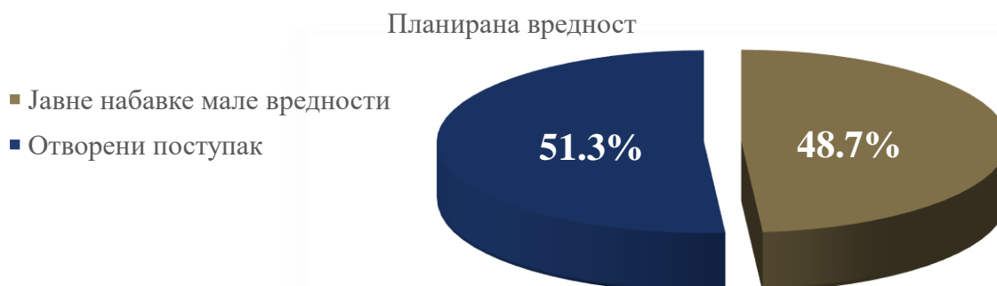
Табела број 5: Преглед поступака јавних набавки по плану јавних набавки 2019. и 2020. године окончани закључењем уговора до 31.12.2020. године